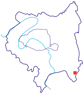
Site «Inventons la Métropole du Grand Paris», Un cœur de village en partage

Rue du Général Leclerc, Rû du Réveillon 94440 Santeny