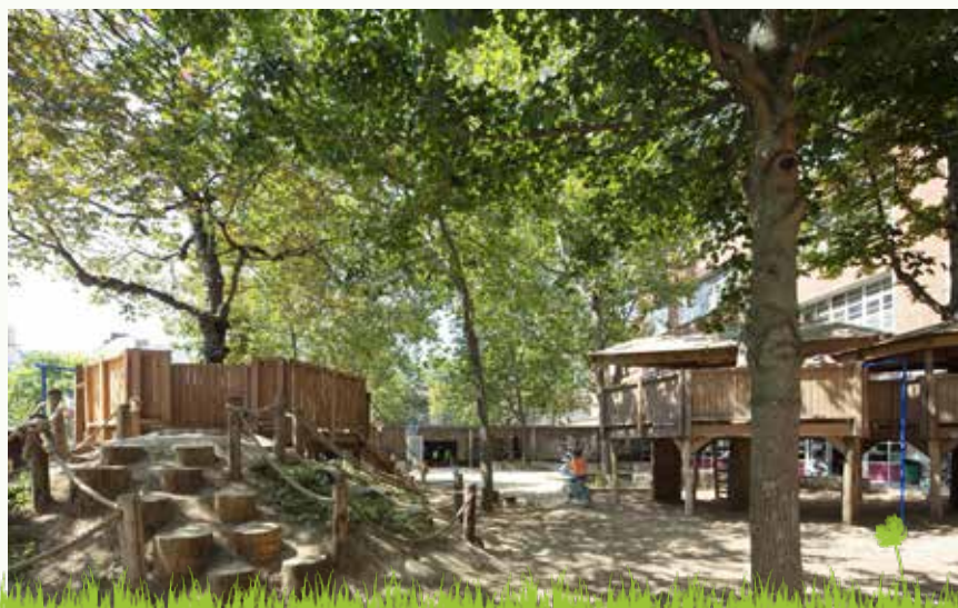
Exemple de "cours oasis"