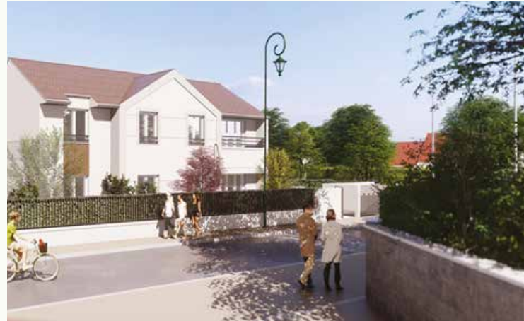
Projet de résidence : "Villa Marie"