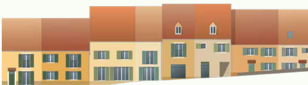
Projet de réhabilitation " Place Guillaume de Gondy"

Les cours oasis dans les écoles sont de véritables écosystèmes qui offrent de nombreux avantages environnementaux. Ces réservoirs de biodiversité, offrent aux élèves un contact direct avec la nature, servent de laboratoires vivants pour l'apprentissage et contribuent à la lutte contre le changement climatique en améliorant la qualité de l'air et en réduisant l'empreinte écologique de l'établissement.