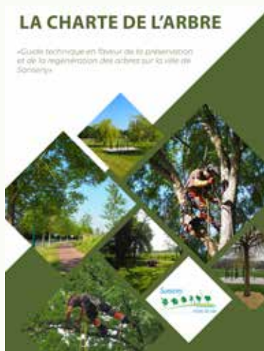
Charte de l'Arbre signée en 2022